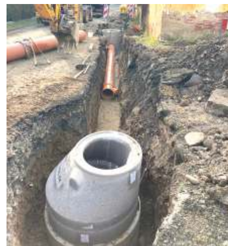
rekonstrukce kanalizace Hluboká