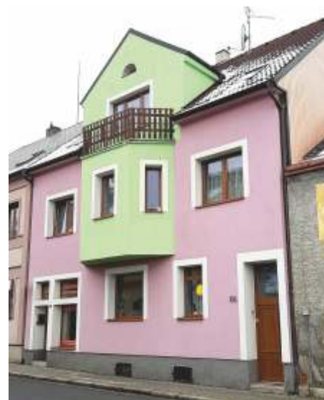
Dům, Komenského ul. č.p. 88 dnes

Dana Procházková, Kdyňe