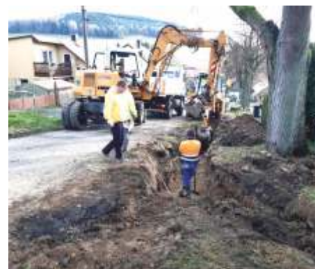
rekonstrukce kanalizace Hluboká