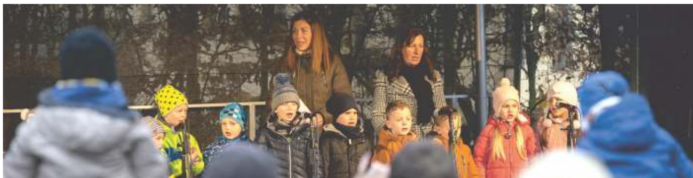
MŠ Markova - rozsvěcení stromečku

Účastníci závodu berou na vědomí, že se závodu účastní na vlastní odpovědnost a nebezpečí a pořadatel nenučí za škody na majetku a poškození zdraví účastníků vzniklé, ani jimi způsobené.