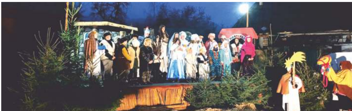
Živý betlém na faře, Kdyně, 22. prosince 2022